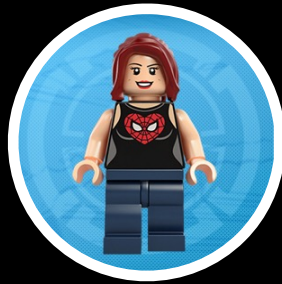
Mercedes Ortiz Communications & Press Manager

jaime@brandmanic.com Twitter. @JdesanRS Mo. +34 609 150 852 Skype. jaime.de.santiago